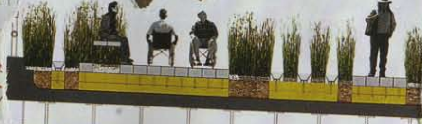
Il progetto di recupero prevede di trasformare l'High Line in parco culturale ed ec